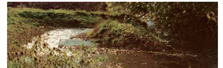
So sieht ein schonender, ökologisch sinnvoller Eingriff am Bachbett des Aubachs aus.

Sperrmülls, der dabei zum Vorschein kam), brutal und ahnungslos an. Mit Ökologie und Gewässerschutz hat das leider gar nichts zu tun.