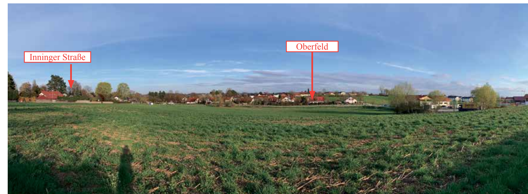
Ecke Oberfeld/Inninger Straße werden ca 32 000 qm Fläche überplant..