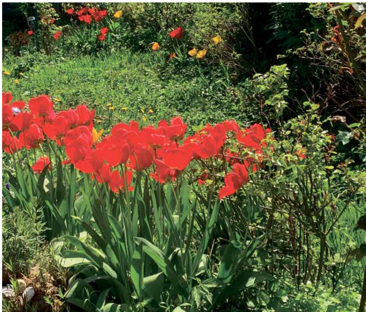
Frühling steht auch für Neuanfang.