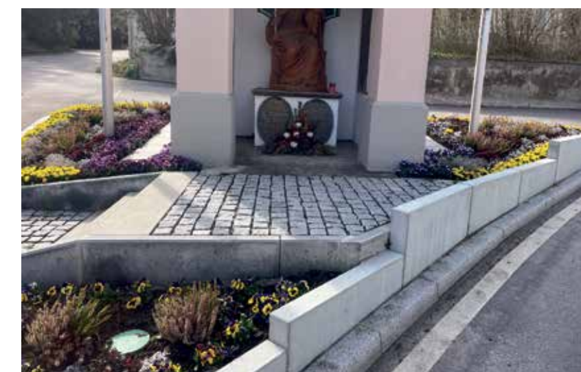
Betonzacken vor der Kapelle in Dröbling

ist ein Schmuckstück und sollte nicht ohne Not durch Betonquader verhunzt werden.