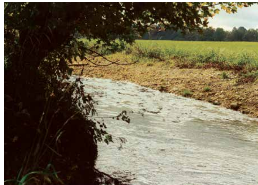
Auch zwischen der alten Kläranlage und dem Wertstoffhof wurden die Ufer vorsichtig abgeflacht, damit sich der Bach seinen Weg suchen kann.

lich: Höhere Wasserstände im oberen Bereich des Bachs oder gar Hochwasser mit überfluteten Kellern in der angrenzenden Bebauung.