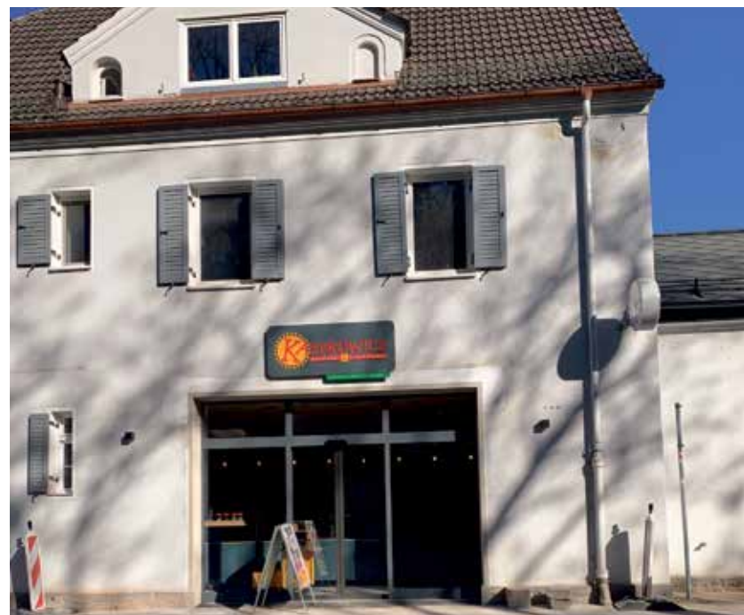
Am 30.04.2026 noch nicht ganz fertig: Die neue Filiale im Bahnhofsgelände

rechtigkeit mit Hochdruck und öffentlichkeitswirksam zu behandeln, gegebenenfalls die Koalition daran platzen zu lassen. Wir müssen im Bewusstsein der Bevölkerung wieder als die Partei der sozialen Gerechtigkeit wahrgenommen werden. Nur so, denke ich, kann uns das gelingen. Ein Schmusekurs mit der CDU / CSU wird uns bundesweit in die Nähe der 5 % bringen.