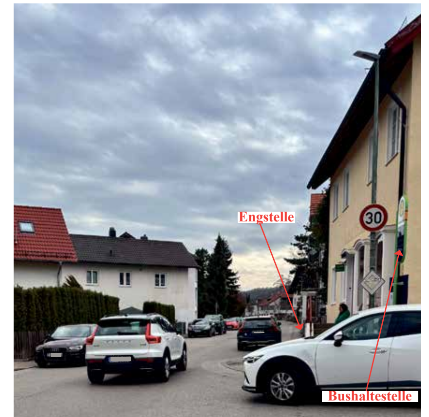
Die unübersichtliche Situation an der Hauptstraße wird entschärft

Ich war als Zuhörer*in nur noch entsetzt und war dabei bestimmt nicht