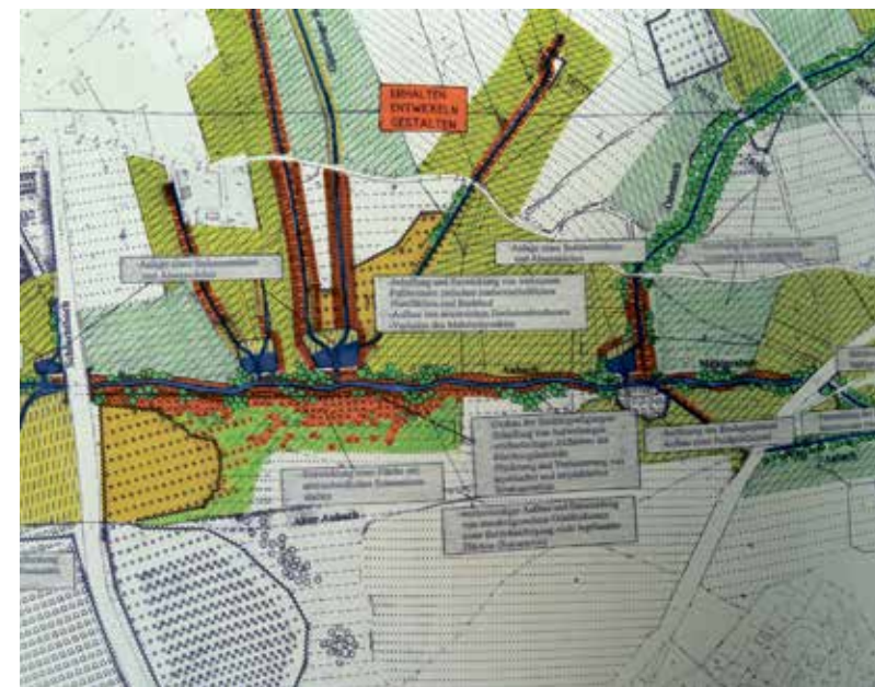
Ein kleiner Ausschnitt aus dem großen, sehr detailgenauen Gewässerpflegeplan des Büros Bolender, Isny, dass die Gemeinde Seefeld Mitte der Neunziger Jahre in Auftrag gegeben hatte.

Das Nadelöhr des Aubachs an der Mühlbachstraße