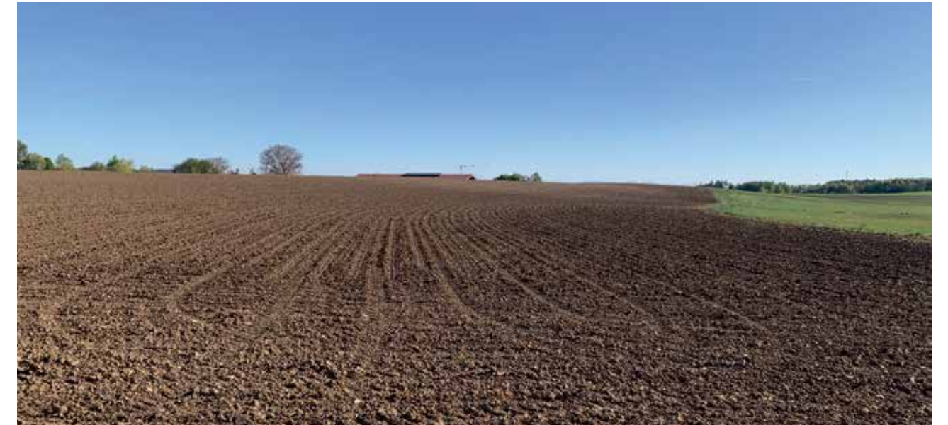
Ein Acker ist sehr wichtig. Aber ist er ökologisch bedeutender als eine Streuobstwiese?

„Beeinträchtigungen von Natur und Landschaft wie sie durch die Ausweisung von Baugebieten im Rahmen der Bauleitplanung, durch den Straßen- oder Leitungsbau oder durch viele sonstige Vorhaben entstehen, erfordern Ausgleichs- und Ersatzmaßnahmen. Dementsprechend sind auf anderen Flächen landschaftspflegerische und der Natur dienliche Maßnahmen durchzuführen, um die ökologische Qualität dieser Flächen deutlich zu steigern. Die somit ökologisch höherwertigen Flächen sollen die Beeinträchtigungen von Natur und Landschaft „ausgleichen“ und sind dauerhaft zu sichern und zu erhalten. Die Gemeinde muss dementsprechend gleichzeitig mit dem jeweiligen Vorhaben oder der jeweiligen Planung für entsprechende Ausgleichs- oder Ersatzmaßnahmen Sorge tragen oder kann auf die Flächen des Ökokontos zurückgreifen und den aktuellen Bedarf abbuchen.“ (Quelle: Bayerisches