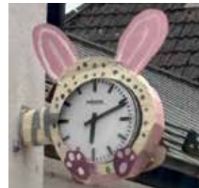
Bahnhofsuhr im Ostergewand

Ein kleines Highlight, das zwar räumlich nah bei der Bäckerei ist, aber eher nichts damit zu tun hat, ist die große Uhr, die nun wieder pünktlich die Zeit anzeigt. Ein Dankeschön dafür an die neuen Eigentümer des Gebäudes.