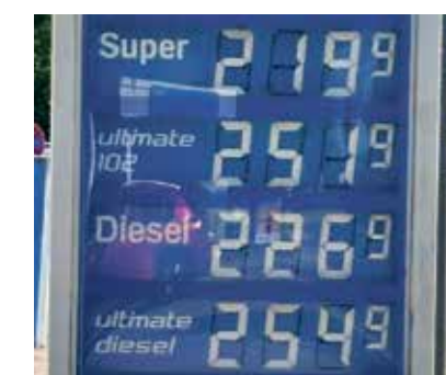
Benzinpreise am 29. April 2026

Einkommen. Denen gilt es zu helfen. So könnten z.B. das Klimageld und die Stromsteuersenkung eingeführt werden, so wie es im Koalitionsvertrag steht. Aber letztendlich wird das auch nicht